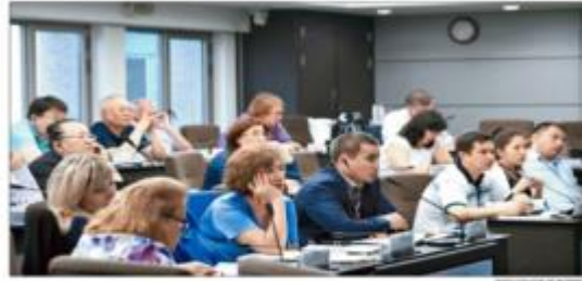
The deans, vice deans and heads of departments from Kazakhstan, who visited the KAIST College of Business under the Professional Development Program for Higher Education Leaders of Kazakhstan 2010, listen to a lecture at the business school in Daejeon, South Korea.

When asked what makes the KAIST business school different from oth-